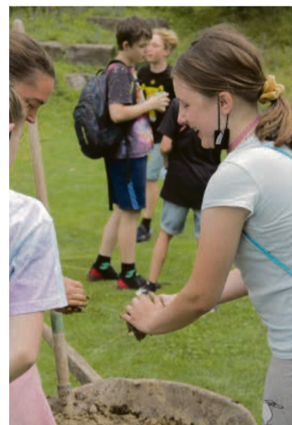
Die Schule Rebacker in Münsingen ist die erste zertifizierte Klimaschule des Kantons Bern.